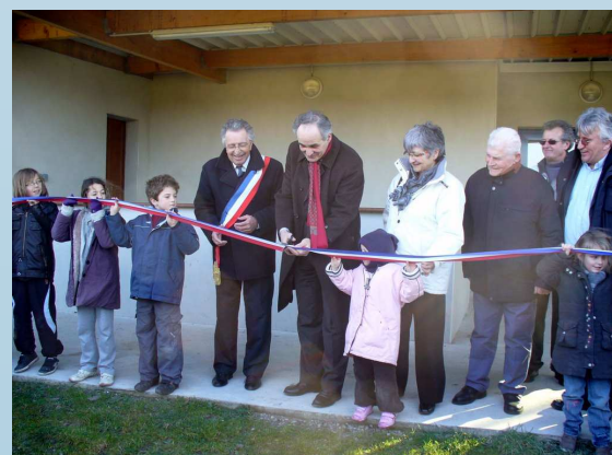
Inauguration salle des sports - Houat - fév. 2010

Lors de l'Assemblée, les élus des îles ont attiré l'attention sur les conséquences importantes que pourrait avoir pour les îles les projets de réforme des collectivités territoriales en cours de discussions : l'obligation d'être dans une Intercommunalité (et le « bonus » qui va avec) qui ne va pas de soi pour certaines îles, la disparition de la « clause de compétence générale » des autres collectivités (Région, Département) - qui interdirait ses financements particuliers, le risque d'éloignement des îles des futurs conseillers territoriaux, autant d'interrogations qui posent la question de la prise en compte de la situation particulière des petites îles côtières. A moins que ce ne soit l'occasion d'innover en leur accordant une attention spéciale pérenne, répondant à leur situation et leur contraintes particulières, également pérennes ! Non pas au nom d'un principe d'exception, mais simplement de celui de réalité et de l'égalité des citoyens.